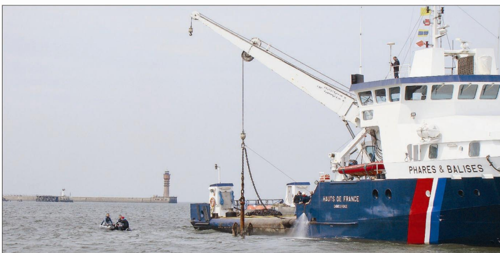
L'ancre a été remontée à la surface le 29 mai 2010. Exactement 70 ans après le naufrage du Mona's Queen III qui a coulé à plus d'un mille de la côte dunkerquoise.