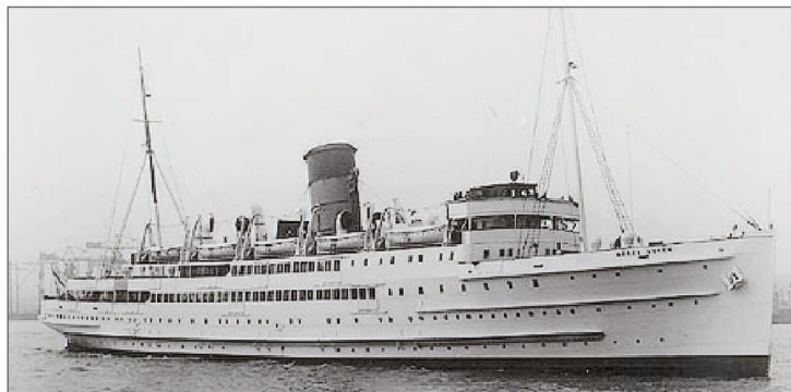
Lancé en 1934, le Mona's Queen III était une "malle", un des bateaux à vapeur de la "Isle of Man Steam Packet Company" qui ne transportait que des voyageurs avec bagages, d'où son nom de malle.